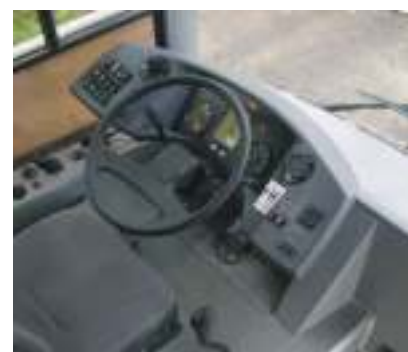
рабочее место водителя