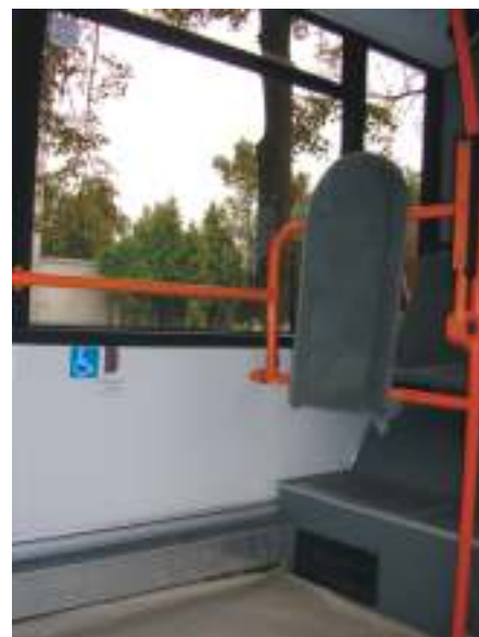
оборудование для перевозки людей с ограниченными возможностями