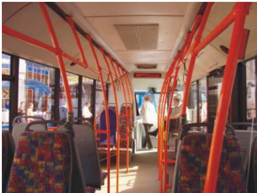
Место крепления инвалидной коляски