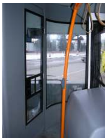
Рабочее место водителя